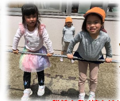
鉄棒も登り棒もがんばるぞー！