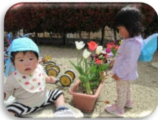
ちゅーりっぷ と たんぼぼ、きれいだね🍀