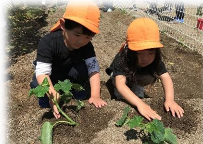
大きいきゅうりになるかな～？

元なきゅうりが収穫できる日を子どもたちと今から楽しみにしています。お当番活動では、毎日の水やりも頑張っています！