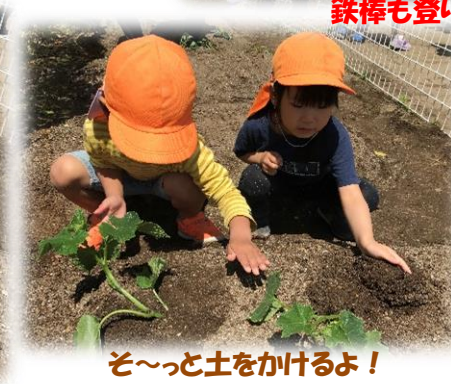
ぞ～っと土をかけるよ！