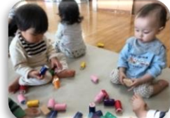
高く積んでみようかな