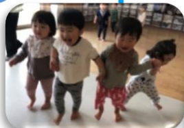
あるこう、あるこう♪

新しい環境に不安を抱いて泣いていたお子さんも、少しずつ担任や園での生活に慣れ、笑顔で過ごせる日が増えています。お外遊びが大好きないす組さんは、お外に行くことを伝えると、喜んで自分の帽子や靴下を探し、準備をしようとする姿が見られています。【健康な心と体】砂遊びや園庭探索、ボール遊びや草花に触れたりなど、自分の好きな遊びを見つけ、体を動かす楽しさや気持ち良さを味わっています。【自然との関わり・生命尊重】室内では、ブロックを重ねたり、車を走らせたりして遊ぶことができます。来月は梅雨時期に入り、戸外に出る機会が少なくなってくるので、室内でも存分に体を動かして楽しめる活動を取り入れ、先生やお友達と一緒に遊ぶ楽しさを味わえるようにしていきたいと思います。