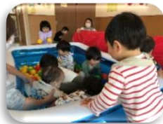
ボールプール、楽しいね